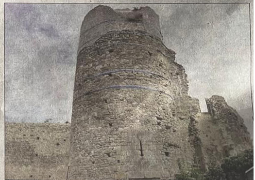
FILET. La tranche 3 concerne la plus grande tour.

► Pratique. Gratuit. Réservation : 02.38.39.18.11.