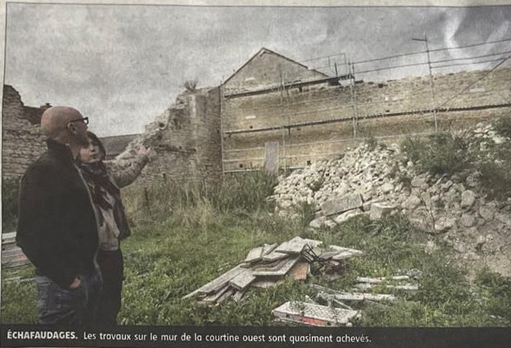
ECHAFAUDAGES. Les travaux sur le mur de la courtine ouest sont quasiment achevés.

Lors de la dernière réunion de chantier, il était prévu que la ré-