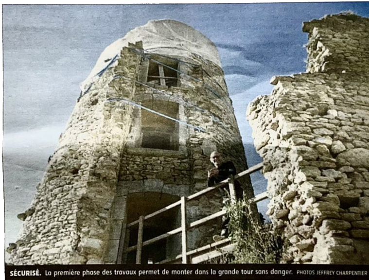
SÉCURISÉ. La première phase des travaux permet de monter dans la grande tour sans danger.