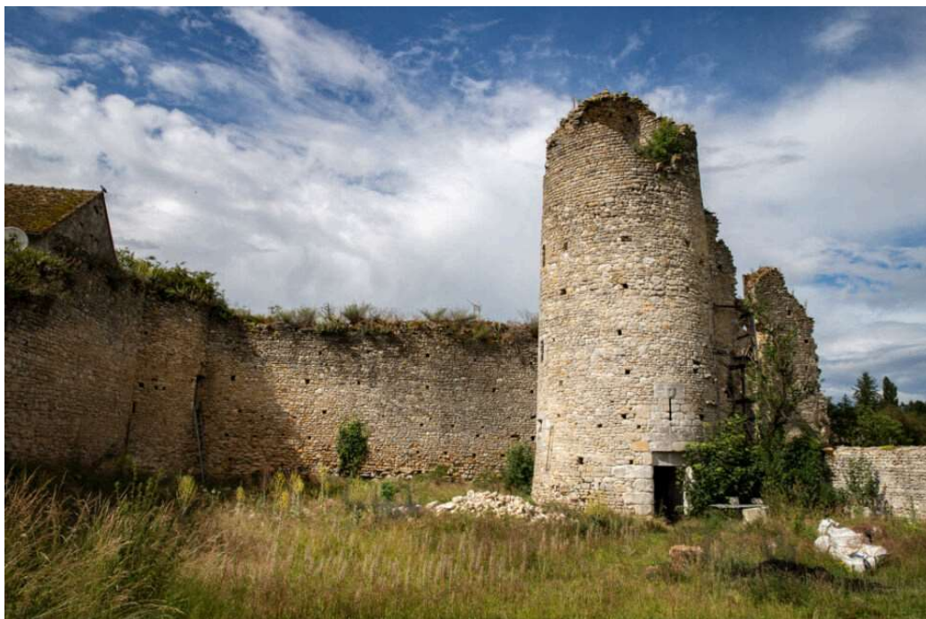
Le château des Deux-Tours, à La Neuville-sur-Essonne. (©Association du Théâtre des Minuit)

La Fondation du patrimoine et Airbnb ont annoncé mercredi 10 juillet 2024 les 37 lauréats de leur programme "Patrimoine et Tourisme local". Parmi eux, un château du Loiret.