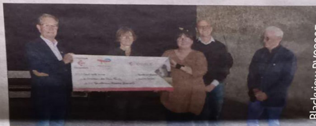
Un chèque de 100.000 € a été octroyé au Théâtre des Minuits.