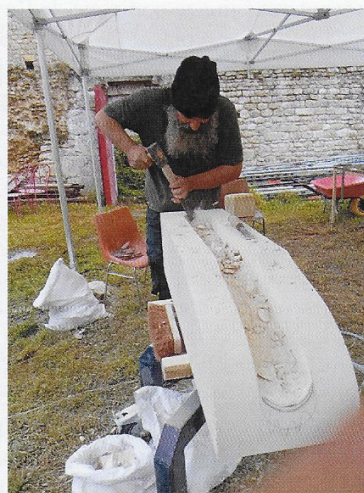
Un tailleur de pierres