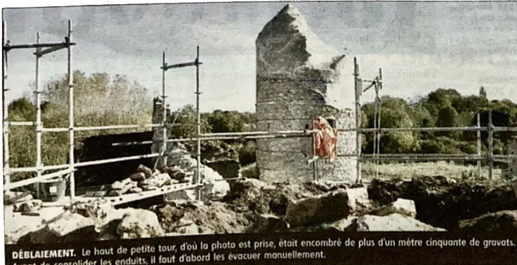
DÉBLAIEMENT. Le haut de petite tour, d'où la photo est prise, était encombré de plus d'un mètre cinquante de gravats. Avant de consolider les enduits, il faut d'abord les évacuer manuellement.

Soutenir. L'opération de financement de la troisième tranche de travaux (la dernière) est en cours. Il est possible d'y participer sur www.fondation-patrimoine.org/les-projets/chateau-des-deux-tours-du-theatre-des-minuits . L'objectif est de récolter 30 000 euros. Le budget total des trois phases de travaux est estimé à 1 533 539 euros.