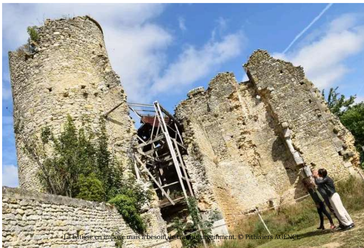
La bâtisse en impose mais a besoin de travaux urgents.

Publié le 19/09/2022 à 14h00 | Aurelie Richard