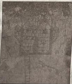
CONFÉRENCE. Sur les graffitis retrouvés dans une des tours.

Au programme : des ateliers pratiques de découverte de la chaux, samedi et dimanche, de 17 heures à 18 h 30 (limité à dix places, sur inscription) ; des visites guidées sur le chantier de restauration et la collecte mé-