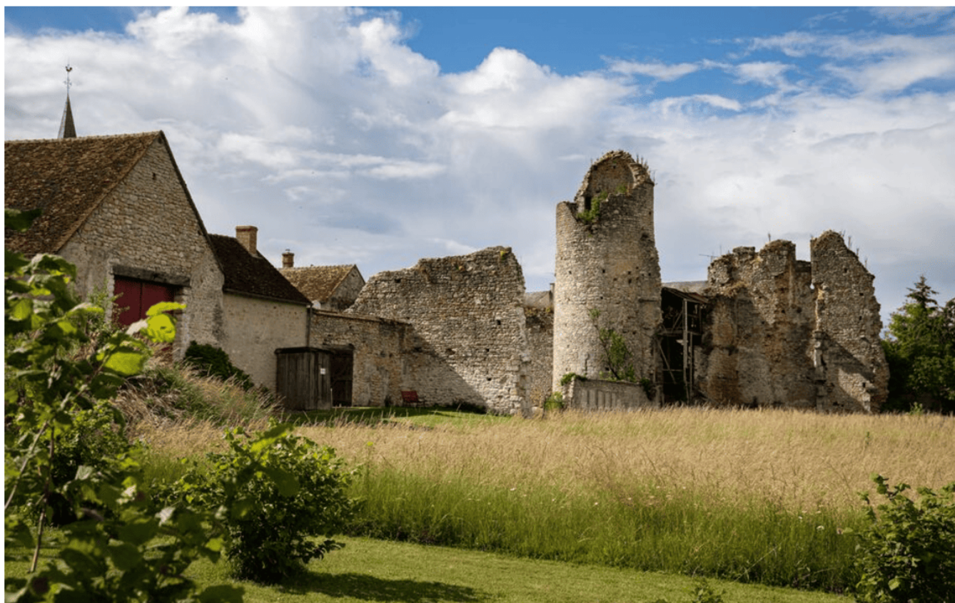
Très délabré, cet ancien chateau fort situé à quelque km de Pithiviers sera sécurisé et l'espace ouvert au public.

Cette troupe a acquis cet ancien château fort basé à La Neuville-sur-Essonne il y a plus de 20 ans et la transformé la grange en tiers lieu artistique. De gros travaux sont prévus, ce qui devrait permettre d'ouvrir les ruines de l'édifice au public et proposer de nouvelles activités.