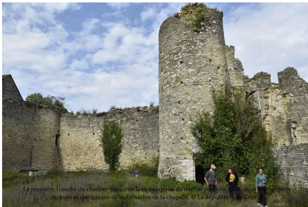
La première tranche du chantier concerne la restauration du mur de courtine nord, du mur du pignon du logis et des travaux de stabilisation de la chapelle.

Publié le 13/10/2023 à 18h38 | aurelie richard